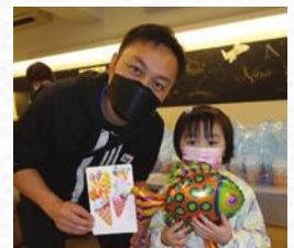
謝謝教會請吃美味的彩蛋

是次的親子活動能夠舉行和完滿結束，全賴「教會與學校」的美好配搭，除了老師們設計有趣的攤位，教會龐大的義工團隊也參與其中，實在感謝他們的愛心和付出，滿滿祝福了培理的家庭。