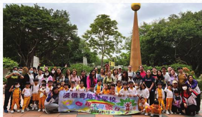
孩子最雀躍的是與爸媽參與親子同樂日。