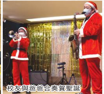
校友與爸爸合奏賀聖誕