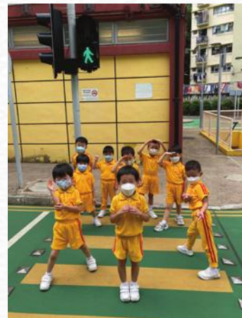
全情投入戶外活動-參觀交通安全城。