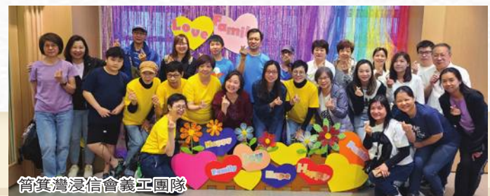
筲箕灣浸信會義工團隊