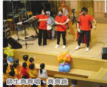
師生齊齊唱、齊齊跳