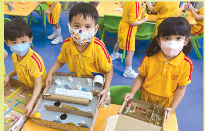
富挑戰性的自製玩具啊！