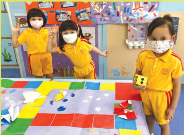
我們一起玩有趣的飛行棋。