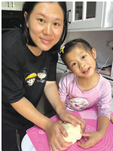
艾澄與媽媽一起搓麵糰。