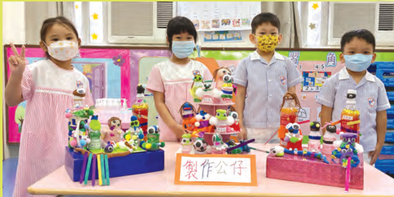
這是我們利用益力多樽及美勞物料製作的娃娃。