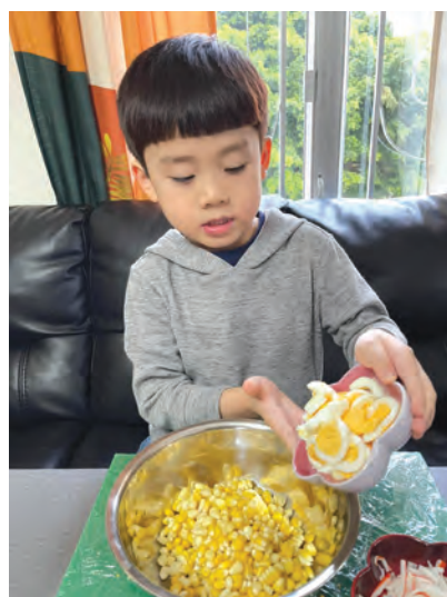
將食物材料混合在一起。