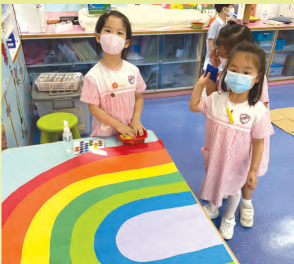
看看誰能拋中目標？