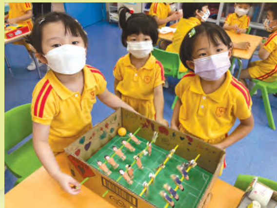
緊張的足球比賽開始啦！