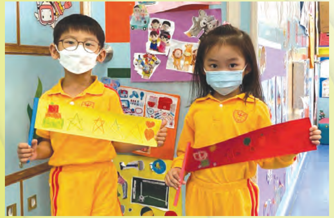
我們製作的伸縮棒多漂亮啊！