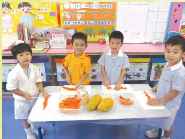
甜蜜蜜的木瓜雪耳糖水。