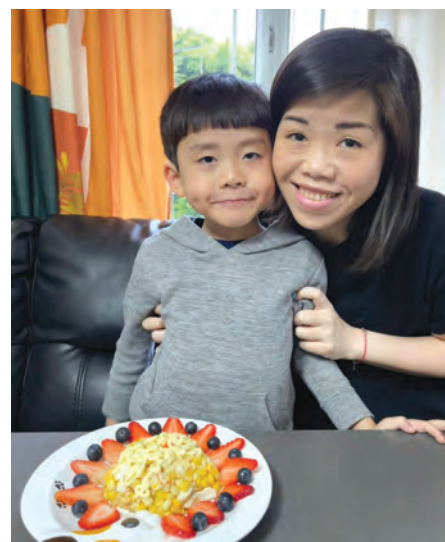
色香味俱全的沙律。