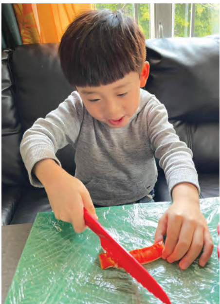
廷鈞細心地切蟹柳。