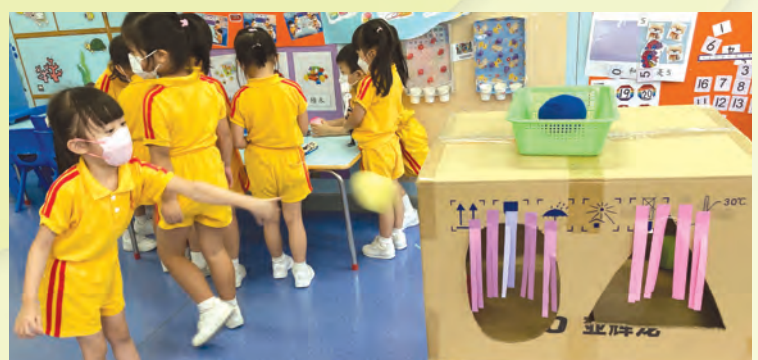
哈哈！我的眼界也不錯呢！