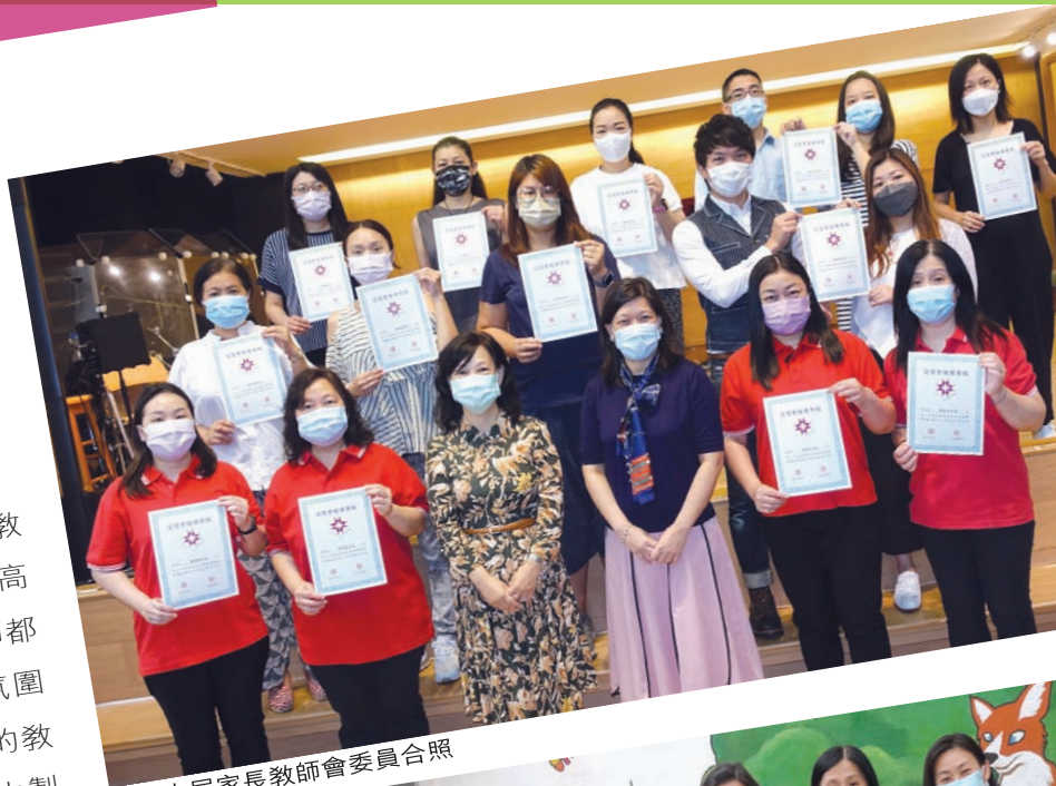
第二十屆家長教師會委員合照

全體委員都十分欣賞校長、主任和老師的教學熱誠及盡責，整個團隊努力不懈地製作高質素的教學影片，每次網上授課時，老師都能令學生感到親切和被鼓勵，在愛的氛圍下，學生就更投入學習，專注聆聽老師的教導。除此之外，學校很有創意地在疫情中製作了《培理小豆苗期刊》，其目的是透過富趣味性的閱讀，引導學生更多關心校園的點滴，在他們的心裡建立一份培理情。所以，委員們一致贊成和支持此刊物的製作。最後，祈願在未來的歲月裡，學校能在變幻莫測的世代中，滿有創意地提升教學的質素。