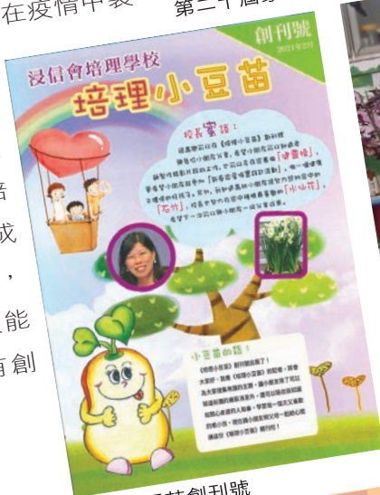
培理小豆苗創刊號