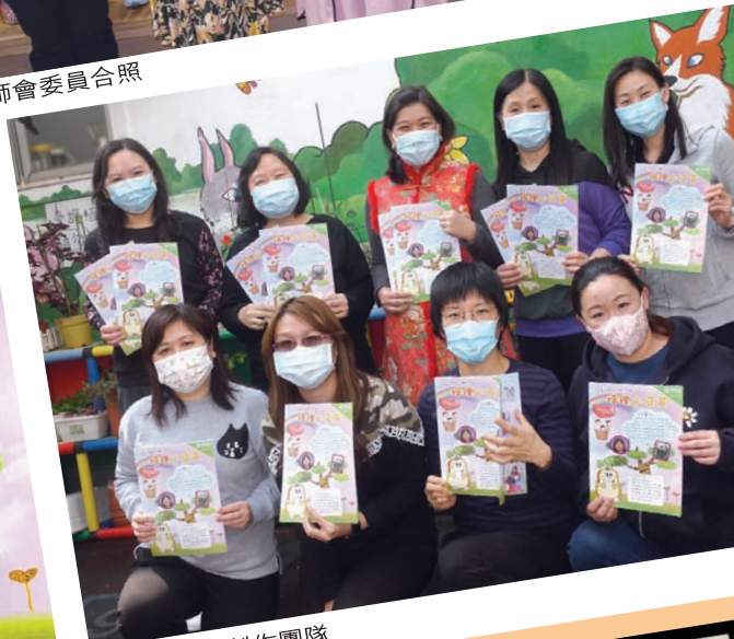
培理小豆苗製作團隊